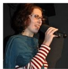
Open Mic POTRVÁ #58 7.11.2012 fotografie: 51