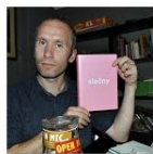
Open Mic POTRVÁ #57 3.10.2012 fotografie: 48