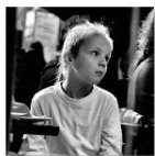
Open Mic POTRVÁ #59 5.12.2012 fotografie: 49