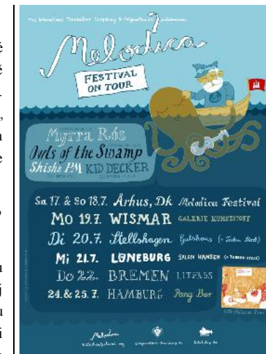
Plakát loňského ročníku festivalu Melodica

OM: Mohl bys nakonec krátce představit projekt Melodica Festival?