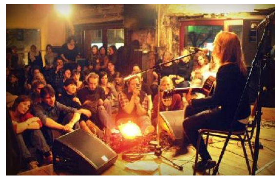
Momentka z berlínského festivalu Melodica Festival